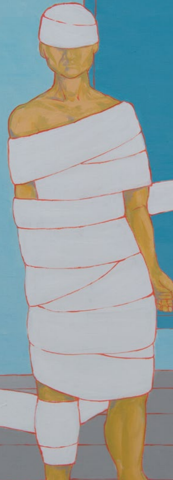
Starke Bindung // strong ties

Mag. Eva Pisa office@evapisa.at | evapisa.at +43 (0) 1 / 869 12 58