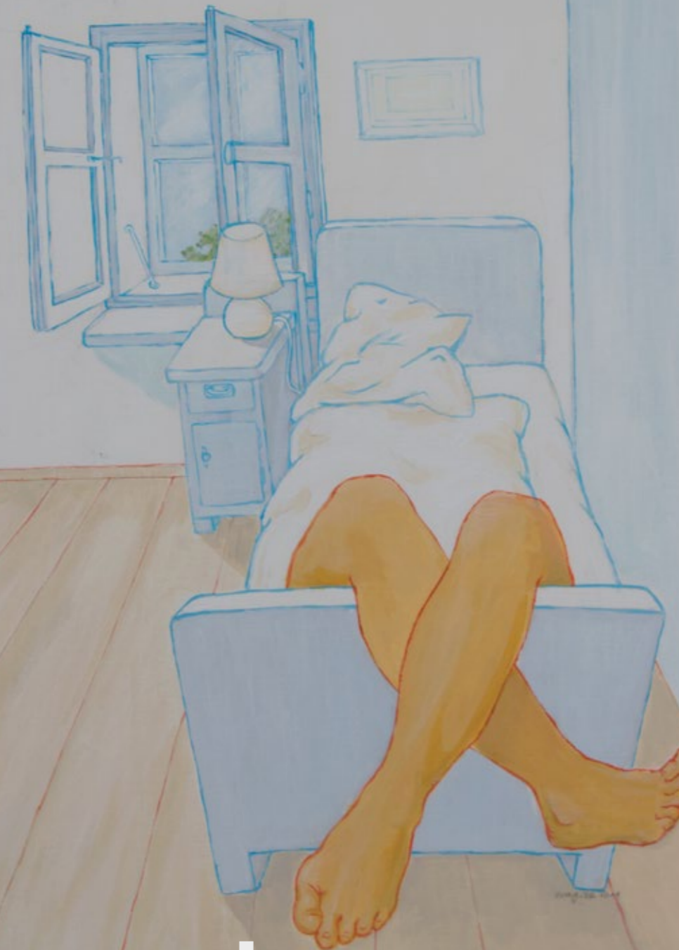
Ländliches Schlafzimmer // rural room