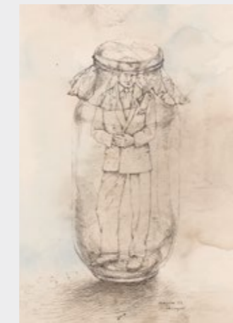
Mitbringsel // souvenir