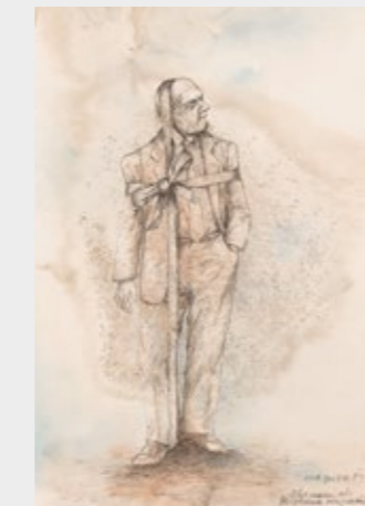
Ehemann als Geschenk // husband.gift