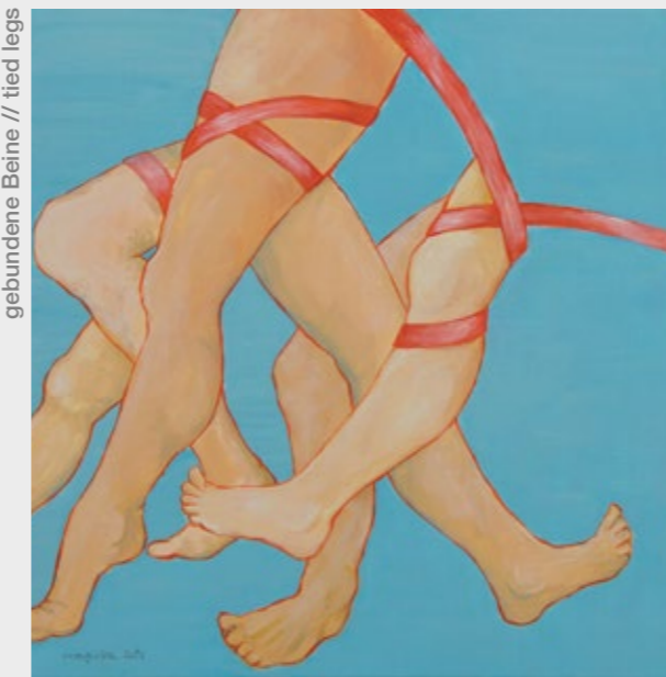
gebundene Beine // tied legs