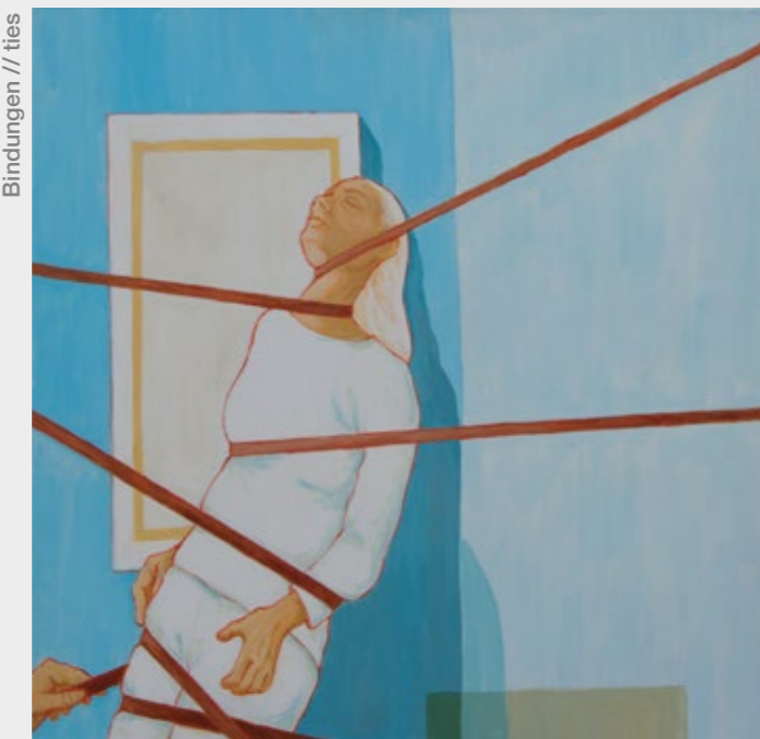
Bindungen // ties